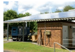
Überdachung Trafostation mit integrierter Photovoltaikanlage - 11,52 kWp