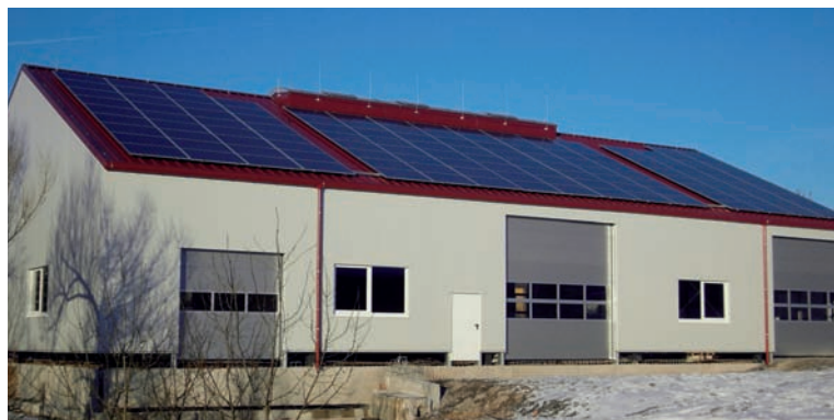
Lager- und Produktionshalle mit integrierter Photovoltaikanlage - 48,84 kWp