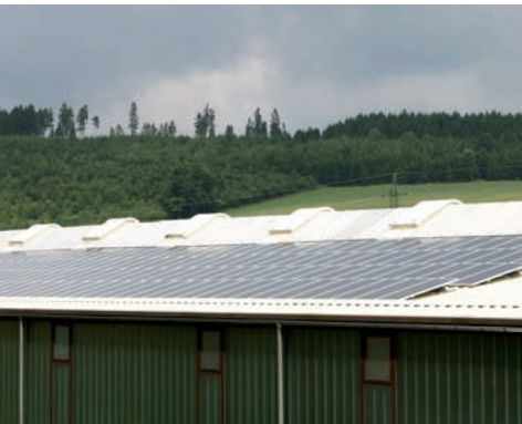
Produktionshalle mit 2000 qm Dachfläche und integrierter Photovoltaikanlage - 89,88 kWp